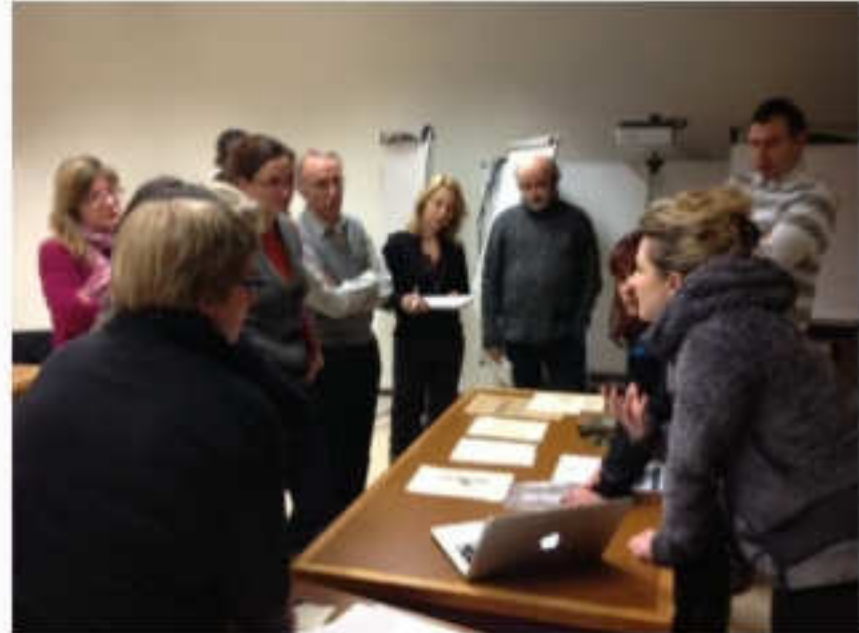
disinfestazione – zona viola