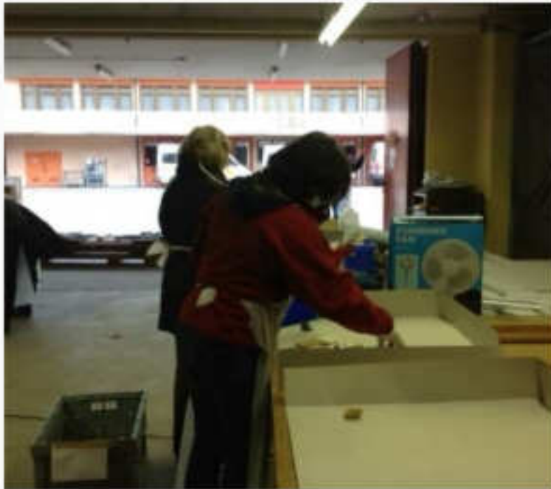
Spolvero zona viola